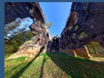
Kostel sv. Jana Křtitele.

také historicky nejnižší naměřená teplota na území dnešní ČR, -42,2 °C, byla zaznamenána právě v únoru. Tento teplotní rekord byl naměřen 11.2.1929 v Litvínovicích u Českých Budějovic.